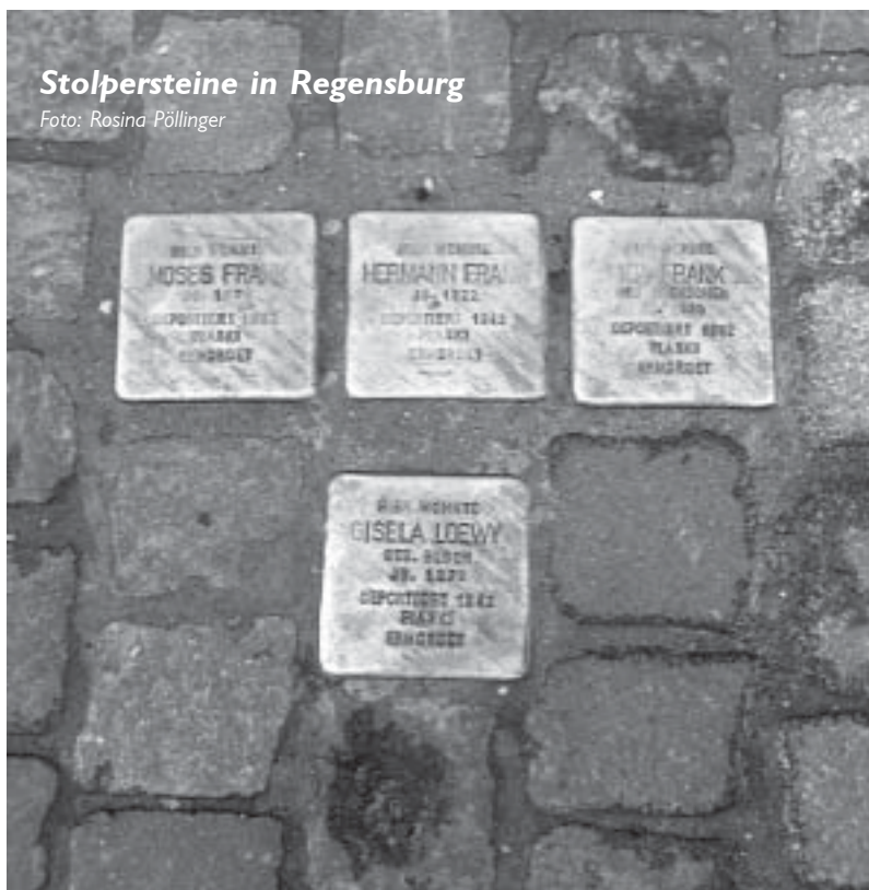
Stolpersteine in Regensburg

In fast jedem Münchner Stadtviertel, das vor 1945 schon bestand, wurden Menschen deportiert und ermordet, weil sie Gegner des Regimes waren oder von diesem zu Feinden erklärt wurden. Solchen Menschen ihren Namen (und oftmals ihr Gesicht) wiederzugeben,