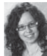
von Anna Katharina Gehring

Alle sagen, Bildung in der frühen Kindheit ist wichtig und mehr Investitionen in diesem Bereich sind nötig, doch folgen auf die Worte auch Taten?