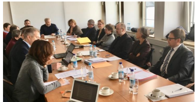
Bei den Verhandlungen

Nachdem sich gezeigt hatte, dass die Verhandlungen auf einem guten Weg sind, wurden bereits Laufzeiten und der Termin des Inkrafttretens des Tarifvertrages in den Blick genommen.