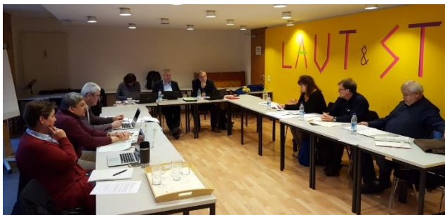
Die GEW Verhandlungsdelegation

Vor Eintritt in die Verhandlungsrunde beriet die Verhandlungskommission ihre Vorgehensweise. Eine Woche zuvor hatte die Arbeitgeberseite der GEW ein Arbeitspapier zugesandt. Dieses Arbeitspapier wurde bewertet und die Vor- und Nachteile nochmals intensiv diskutiert. Bereits am Wochenende zuvor hatte die GEW-Landestarifkommission ihre Positionierung dazu vorbereitet.