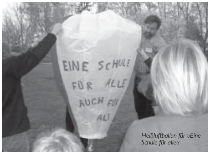
Heißluftballon für »Eine Schule für alle«

Sonderschullehrerin in Bamberg mit Schwerpunkt Kooperationsklasse und MSD lernwerkstatt@t-online.de