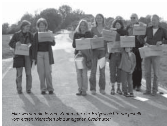
Hier werden die letzten Zentimeter der Erdgeschichte dargestellt, vom ersten Menschen bis zur eigenen Großmutter