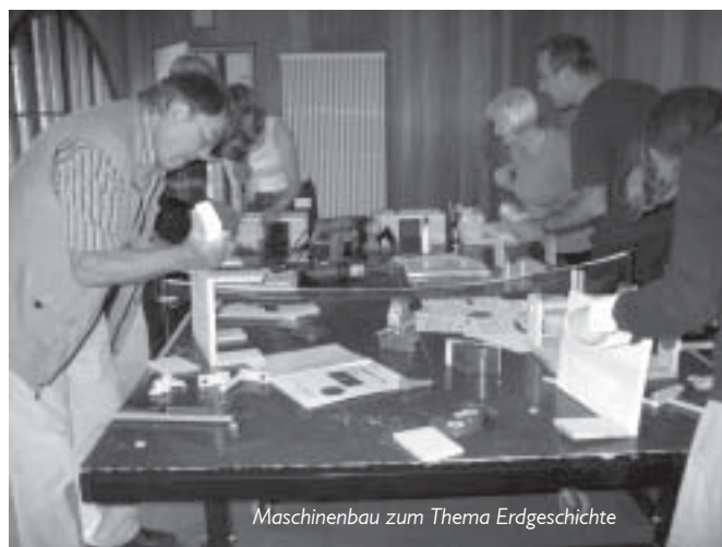
Maschinenbau zum Thema Erdgeschichte