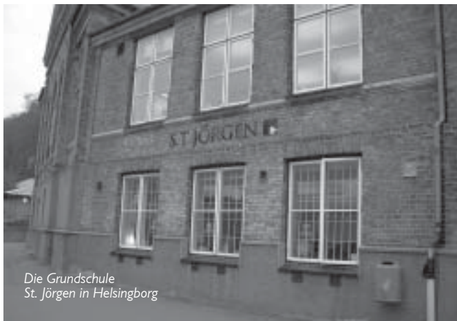
Die Grundschule St. Jörgen in Helsingborg

Erreichen der Ziele dokumentiert und reflektiert. Die Lehrkräfte schreiben einen kurzen Kommentar und auch die Eltern können Anmerkungen machen. In Lerngruppen mit 15 bis 20 SchülerInnen stellen wir eine ruhige Arbeitsatmosphäre fest. Die Schule ist – wie auch die anderen besuchten Schulen – gut mit Computern (mit Internetzugang), Beamern und Smartboards ausgestattet. Die weißen Wandtafeln werden überwiegend als Planungsinstrument (z. B. Tagesablauf, wichtige Termine der Woche) verwendet.