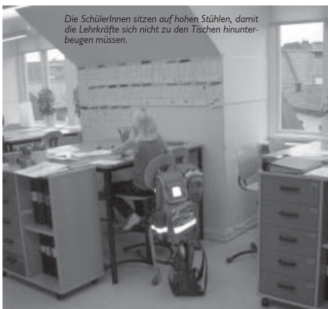
Die SchülerInnen sitzen auf hohen Stühlen, damit die Lehrkräfte sich nicht zu den Tischen hinunterbeugen müssen.

An dieser Schule wird der Unterrichtsstoff in allen Fächern in 35 Stufen eingeteilt, die die SchülerInnen individuell zu bearbeiten haben. Dabei ist immer nach fünf Stufen ein Test zu absolvieren. Wird dieser nicht bestanden, muss der Stoff wiederholt werden. Erst nach bestandenem Test geht es weiter. Es werden Einführungsstunden gehalten (Bei-