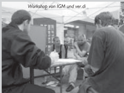
Workshop von IGM und ver.di