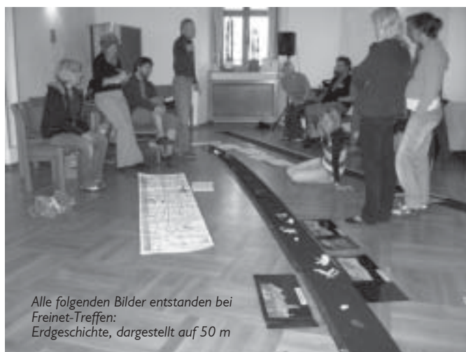
Alle folgenden Bilder entstanden bei Freinet-Treffen: Erdgeschichte, dargestellt auf 50 m

Und das tun wir seit 30 Jahren zweimal jährlich in Bayern auf den Freinet-Treffen. Diese Fortbildungen sind von besonderer Art: Genauso bunt wie das Buffet, das die Teilnehmerinnen und Teilnehmer am Freitagabend selbst mitbringen, ist das Programm, das sich jeder selbst aus den vielfältigen Angeboten zusammenbasteln kann ( siehe Fotos ). Alle Themen, die uns berühren, werden zur Sprache gebracht. Es werden keine ReferentInnen eingeladen, sondern das Wort ergreifen diejenigen, die etwas zu berichten haben. Doch meistens bleibt die Fortbildung nicht nur bei