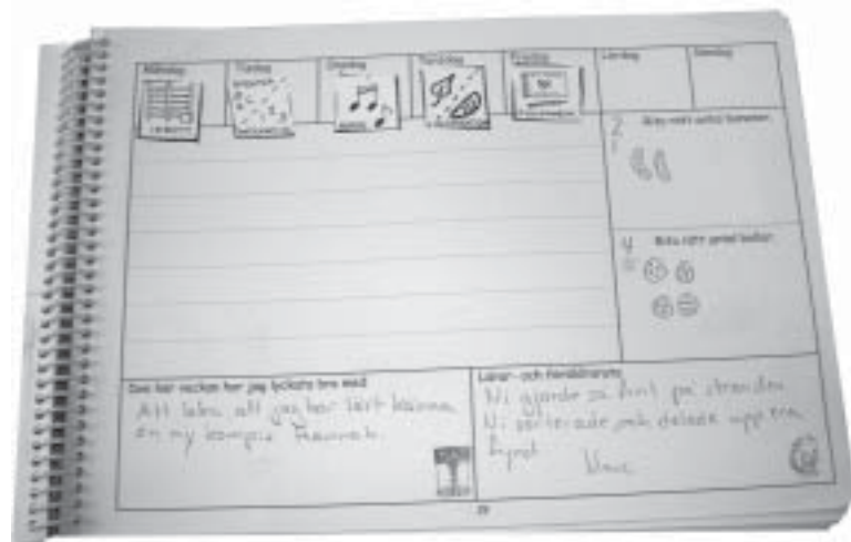
Bereits in der Vorschule führen die SchülerInnen ein Schultagebuch