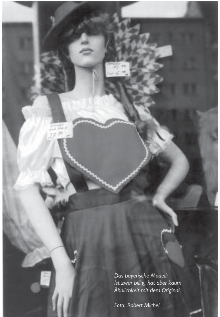
Das bayerische Modell: Ist zwar billig, hat aber kaum Ähnlichkeit mit dem Original.

Schulsozialarbeit, wie sie bisher praktiziert wurde, wendet sich hingegen prinzipiell an alle SchülerInnen einer Schu-