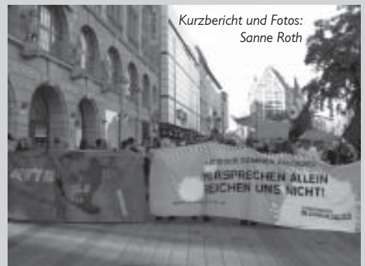
Kurzbericht und Fotos: Sanne Roth

wurde enthusiastisch beklatscht. Ihm gelang es, sowohl die Kritik am Bildungssystem als auch die GEW-Forderungen in einer Weise darzustellen, die seinen ZuhörerInnen entsprach und gefiel.