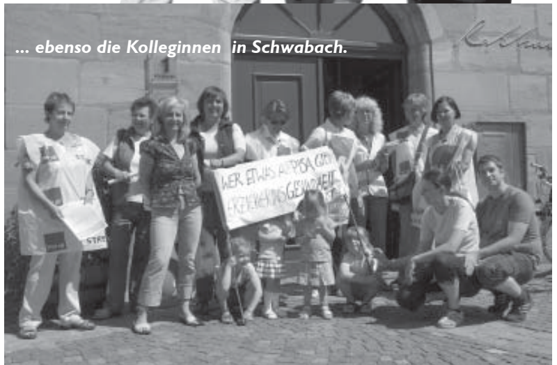
... ebenso die Kolleginnen in Schwabach.