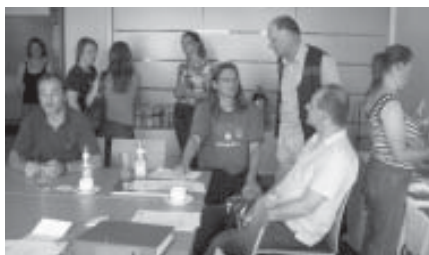
... auch die Nürnberger Kolleginnen und Kollegen waren wieder dabei ...