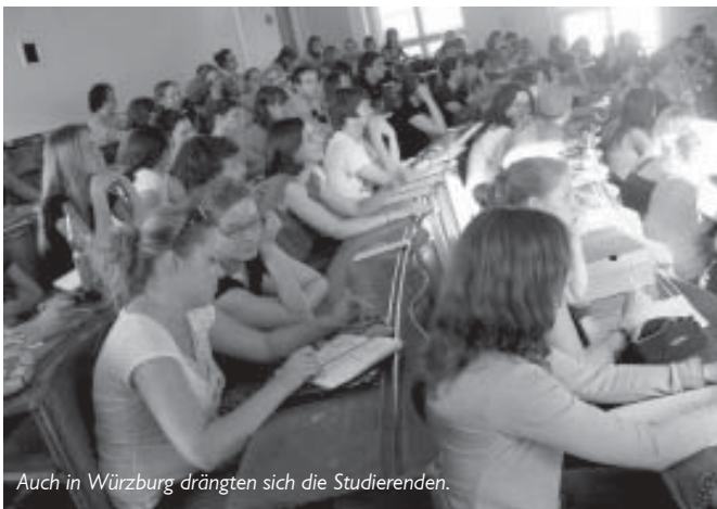
Auch in Würzburg drängten sich die Studierenden.