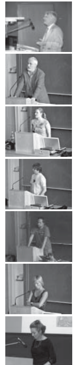
Die ReferentInnen (s. Fußnote linke Spalte)