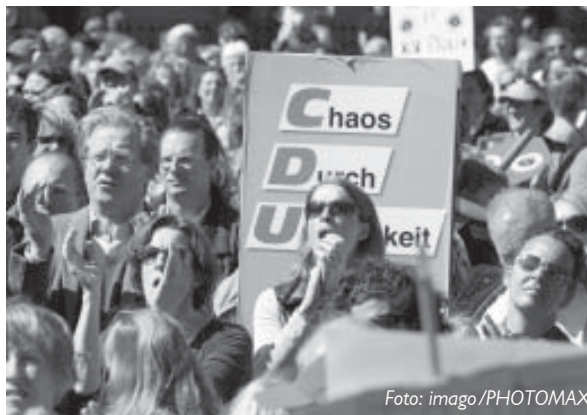
Elternproteste in Hamburg gegen die Einführung der 6-jährigen Primarstufe.

Wenn das selektive Schulsystem die Bildungsarmut von Kindern der unteren sozialen Schichten verfestigt, ihnen und den behinderten Kindern Teilhaberechte verweigert, sie menschlich entwertet und zu den gesellschaftlich Überflüssigen macht, dann geht die Verletzung ihres Menschenrechts auf Bildung uns alle an. Wie können wir sonst glaubwürdig in Menschenrechtsfragen auftreten, wenn wir hierzu schweigen? Unser demokratisches Zusammenleben ist infrage gestellt und die langfristigen gesellschaftlichen Schäden und Folgekosten von Desintegration und Exklusion müssen auch von allen getragen werden.