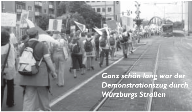
Ganz schön lang war der Demonstrationzug durch Würzburgs Straßen