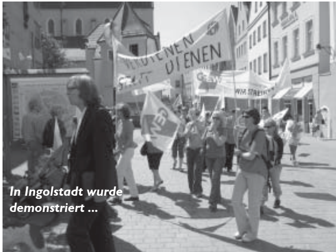
In Ingolstadt wurde demonstriert ...