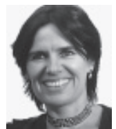
von Miriam Herrmann, M. A.

Wenn sich an ihrer Situation in absehbarer Zeit nichts Wesentliches ändert, werden immer weniger von ihnen sich diese Arbeit noch leisten können.