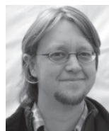
von Michael Schätzl Landesfachgruppe Gymnasien

Deshalb lehnen wir die Erfassung von personenbezogenen Daten für eine zentrale Datenbank grundsätzlich ab!